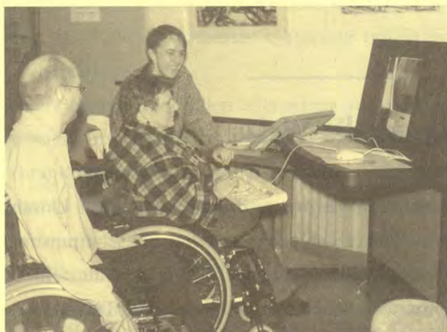
Erste Versuche bei der Eröffnung des Terminals

Zu den zentralen und populärsten Diensten im Internet gehört sicherlich das elektronische Postsystem. Mit Hilfe sogenannter E-Mails kann man zum Ortstarif einer Telefongebühreneinheit Nachrichten an Adressaten im letzten Winkel der Erde verschicken. Blitzschnell, überaus sicher, preisgünstig und umweltschonend (da materiellos) erledigt man so den Versand von Texten und Multimedia-Dokumenten (also Bild-, Film- und Tondateien). Aufgrund ihrer vielfachen Vorzüge ent-