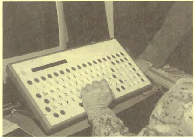
Lochtastatur für Menschen mit Bewegungseinschränkungen

Außerdem lassen sich auf diesem Wege auch Diskussionsrunden zu selbstgewählten Themen eröffnen. Änderungen im Gesundheitswesen, die Benachteiligung von Kranken im Alltag, die Stellung von Behinderten in der Rechtssprechung – zu jedem Spezialgebiet darf man seine Ansichten äußern und andere Usenet-Anwender zur Gegendrede auffordern. So entstehen häufig feste Diskussionszirkel oder sogar Freundeskreise, die das gemeinsame Interesse an einem bestimmten Thema längerfristig verbindet. Das „größte, interaktive Anzeigenblatt“ der Welt wird in den letzten Jahren gern als Treffpunkt gleichgesinnter Behindertener genutzt. So manche intakte Solidargemeinschaft ist dabei schon entstanden.