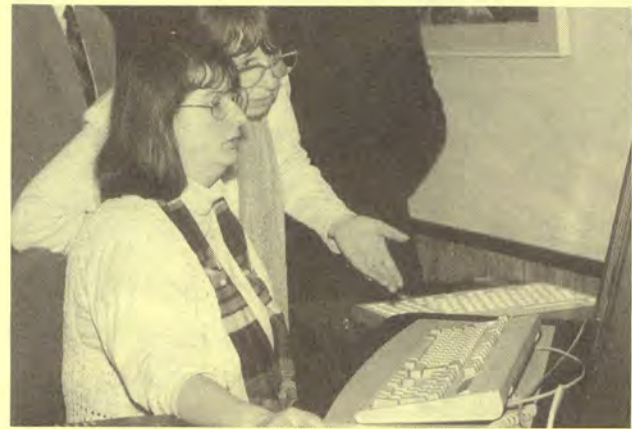
Mitarbeiterinnen nutzen die Chance

Doch egal, was Behinderte auf solch einer Homepage auch darstellen, diese Plattform eröff-